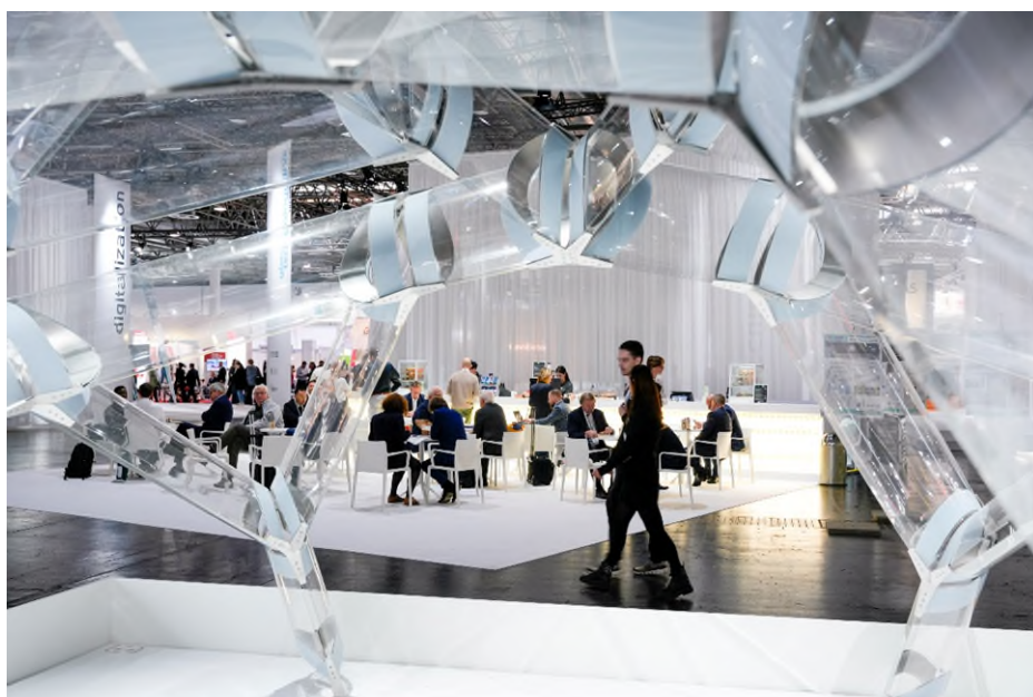
glass technology live (gtl)