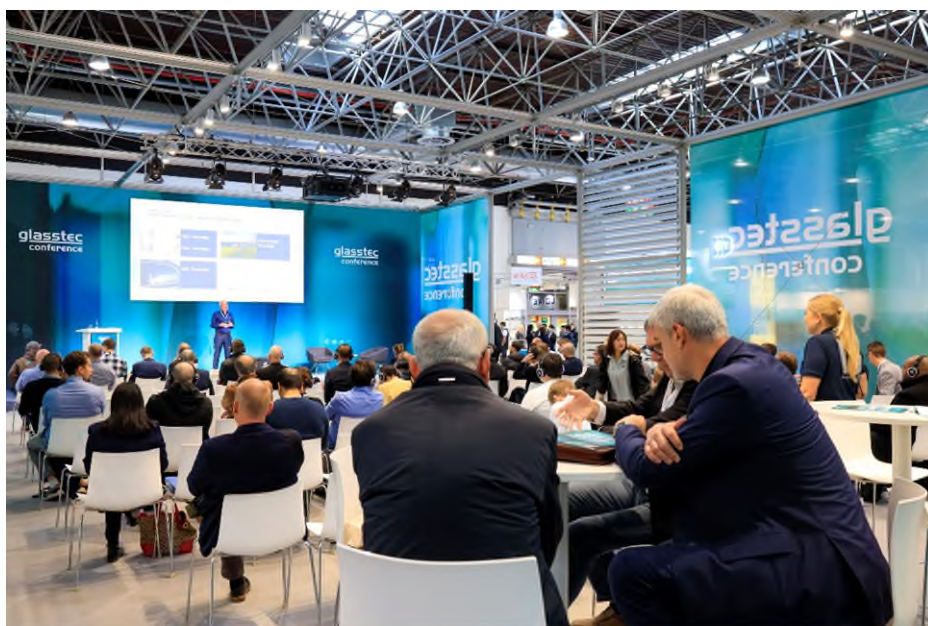
glasstec conference 2024