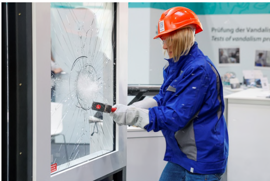
Handwerk LIVE, IFT Rosenheim, Vandalismus Test